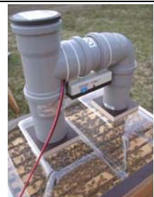
Aparato puesto en colmena (Aparato puesto en colmena con tapa transparente.)