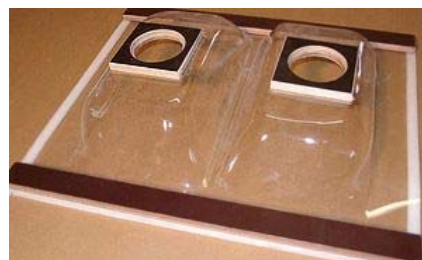
Tapa transparente (se hace a la medida de la colmena del cliente)